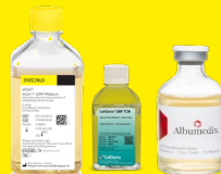
培地 | 試薬

Technologies for all phases of drug manufacturing