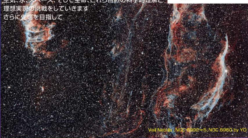
Veil Nebula, NGC 6992-5, NGC 6960, by Y.O.

Airex は新しい世界ブランド X'Sona を立ち上げました アイソレーター、RABS、除染、滅菌のシステム構築を通し、 空気、水、スペース、そして生命、これら自然の科学的理解と 理想実現の挑戦をしていきます さらに先端を目指して